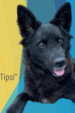
Unser Schulhund „Tepsi“