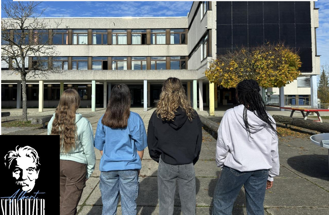
Neue Farben von links nach rechts: sage green – dusty indigo – black – dusty purple